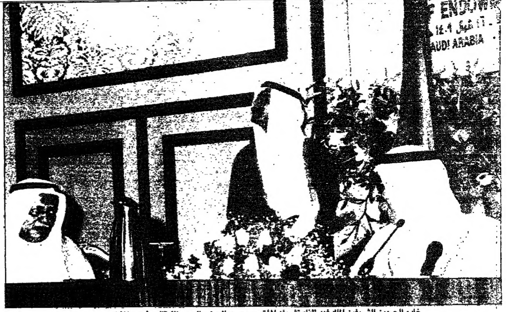
خادم الحرمين الشريفين الملك فهد أثناء تشريفه المؤتمر ويري معالي وزير الحج والأوقاف رئيس المؤتمر

تكنولوجيا رقمية فائقة الدقة من هونغ كونغ حققت هونغ كونغ خطوة مهمة في حل التكنولوجيا الرقمية بقتل مخترعات هونغ كونغ ديجيتال المحدودة التي تتقود بخبرة واسعة وإضافة في هذا المجال والتي توفرنا حثيا مجموعة من القياسات المترية الكهربائية للاحتراق . وهكذا تحورت القياسات الآن من الخطأ وعدم الدقة الناتج عن التخمين بقنيسة للموقع الصحيح للمؤشر كما هو الحال بالقنيسة للمؤشرات الاخرى المعقدة . فان قياسات ديجيتال المترية تحدد ذلك بدقة ووضوح دون لخطأه لطفا العرض الرقمية بسائل الكريستال . ان احر ميكرات هونغ كونغ ديجيتال تتضمن عداد القياس المترية متعدد الاستعمالات بالإضافة الى قياسات مترية تحلل بايد وقياس مترية رقمي من طراز القلم وجميعها مصممة بدقة متناهية لقياس أكثر من مواصفات كهربائية . مع نظام تشغيل بالقياس المطلوب ٢٠٠-٢٤٠ فولط ما بين ٤٧ و٦٣ هرتز فان القياس المترية البالغ الحساسية مصمم لتقديم بعد الوحدات القليلة للتحويل الى سرعات التردد وفرات التثبيت كما هو محدد بوظيفة التشغيل المختارة . شاشة العرض المكونة من ٨ ارقام الديجيتال الثلاثي الملحي) توفر قراءة دقيقة وواضحة لقياسات التردد (ميغرتز ١٠ هرتز الى ٨٠ ميغاهرتز) . العداد التصفدي ٥٠ ميغاهرتز الى ١٠٠٠ ميغاهرتز . فترة التثبيت (١٠ ميكروثانية الى ١٠ ثوان . والمد على قاعدة رقمية ميغاهرتز لمقدار الطاقة الجيوش . و ٧.٨١٢٥ ميغاهرتز لمعداد التصفدي . أداء عال وطاقة منخفضة . تلك هي مميزات القياس المترية المتعدد طراز القلم الرقمي الذي يقوم بقياس المقاومة الكهربائية وللوظائف بالقياس المطلوب واليشرح .